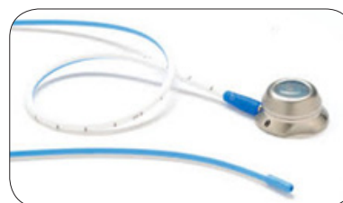
PAC ou Chambre à Cathéter Implantable